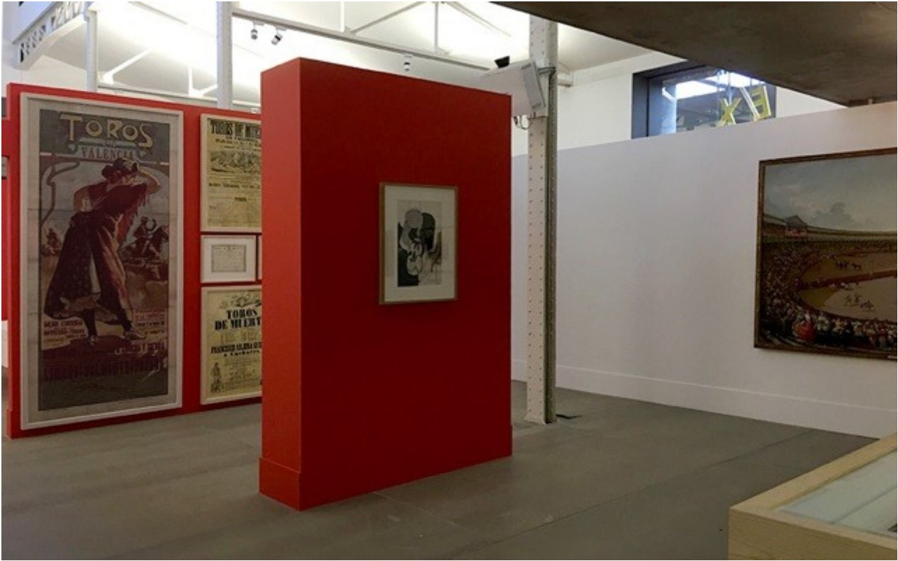
Galería de Imágenes: